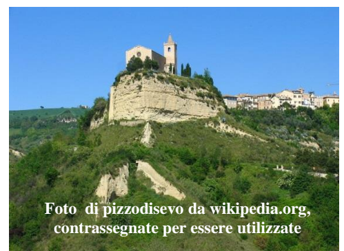
Foto di pizzodisevo da wikipedia.org, contrassegnate per essere utilizzate