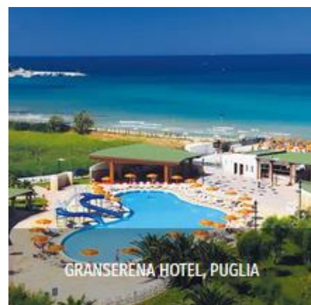
GRANSERENA HOTEL, PUGLIA