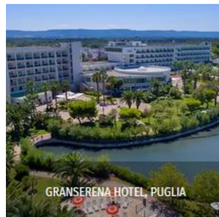
GRANSERENA HOTEL, PUGLIA