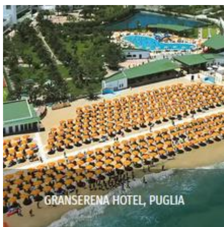
GRANSERENA HOTEL, PUGLIA