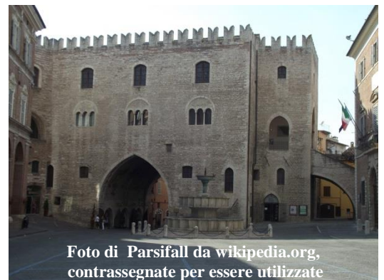
Foto di Parsifall da wikipedia.org, contrassegnate per essere utilizzate