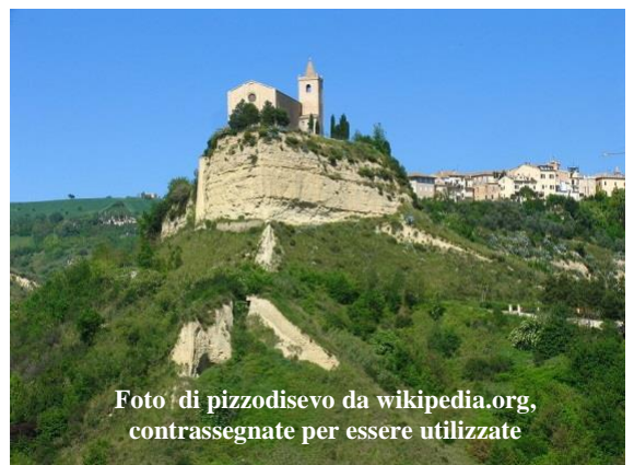
Foto di pizzodisevo da wikipedia.org, contrassegnate per essere utilizzate